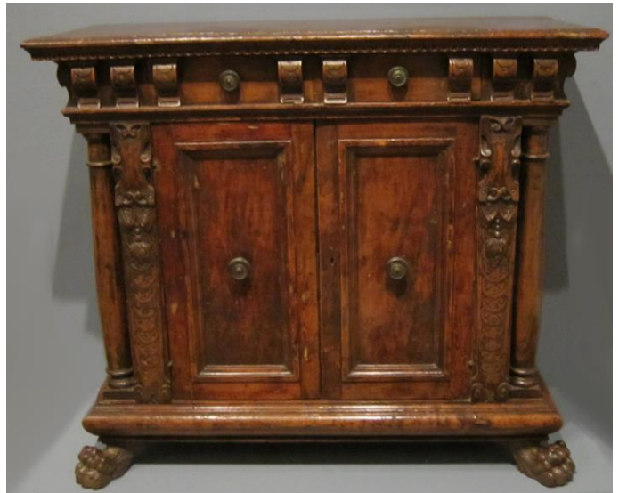
Zdj.1 Kredens Credenzone .

Znany już od początku XV wieku jako mebel skrzyniowy służący do przechowywania sprzętu stołowego, w którym trzymano także zamknięte potrawy, sprawdzone jako niezatrute z czym wiąże się źródłosłów nazwy z łacińskiego credo czyli wierzę. W zdobniejszej i okazalszej formie istniał w renesansie włoskim, w meblarstwie włoskim roku 1500 pod nazwą credenzone , jako mebel pośredni pomiędzy skrzynią, a szafką. Był niską, szeroką rozbudowaną szafką, zamykana z przodu dwoma drzwiami (choć rzadziej okazywały się pojedyncze czy wielodrzwiowe), nad którymi znajdowały się szuflady, gdzie na wierzchu stawiano dzbany, misy, puchary czy naczynia stołowe. Był zdobiony dekoracjami rzeźbiarskimi z motywami architektury epoki. W późniejszych czasach naśladowany w meblarstwie francuskim, gdzie powstały jego odpowiedniki w postaci dressuar (fr. dressoir ) czy bufet (fr. buffet ).