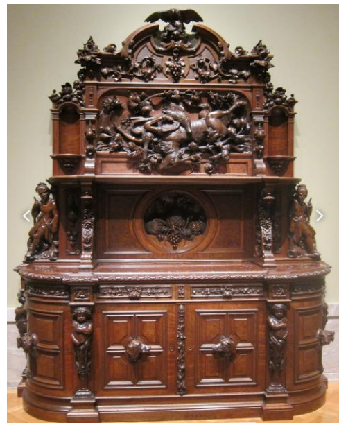
Zdj.2 Bufet z poł. XIX w.